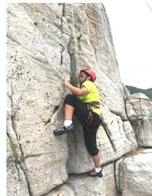
108 年暑假攀岩、獨木舟、浮潛系列課程